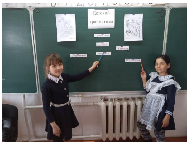
Классный час "Секрет хорошего настроения" 3 класс